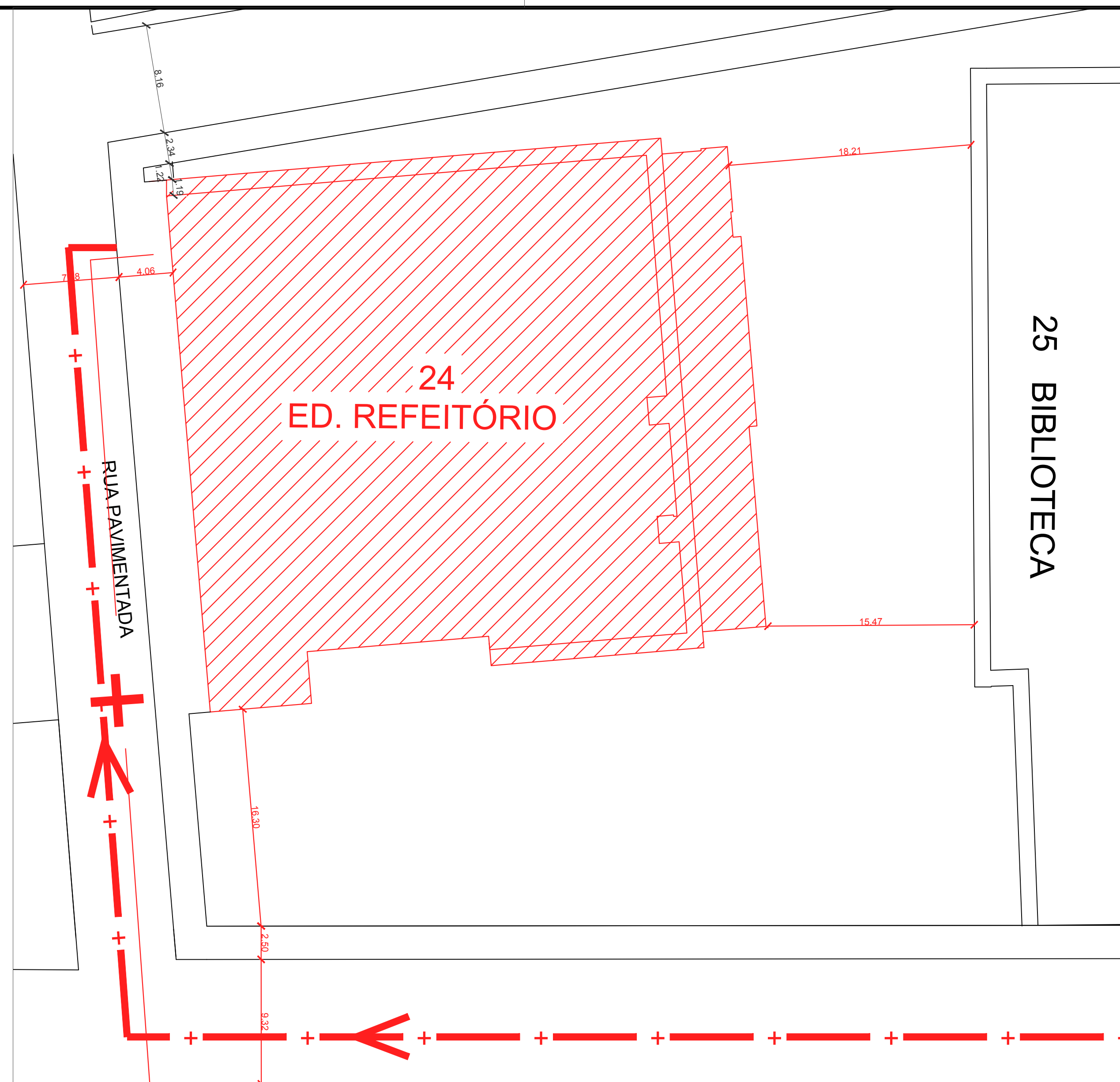
PLANTA DE LOCALIZAÇÃO ESCALA: 1/500